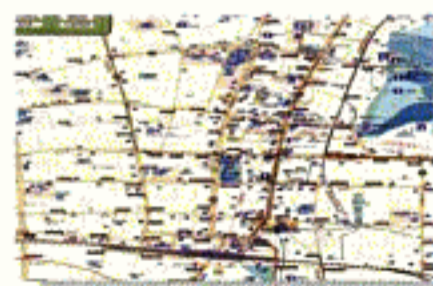
▲岐阜市まちあるきマップ