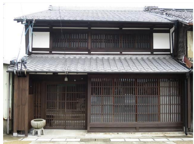
75. 〈歴史的建造物〉 岐阜市靱屋町

【改修内容】屋根葺き替え、樋取替え、格子塗替え、漆喰やり替え、玄関引き戸設置、窓サッシ取替え