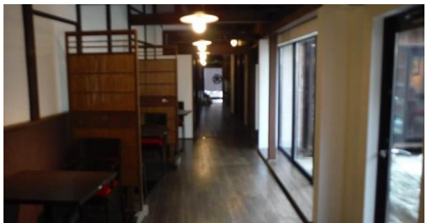
76. 〈歴史的建造物〉 岐阜市玉井町