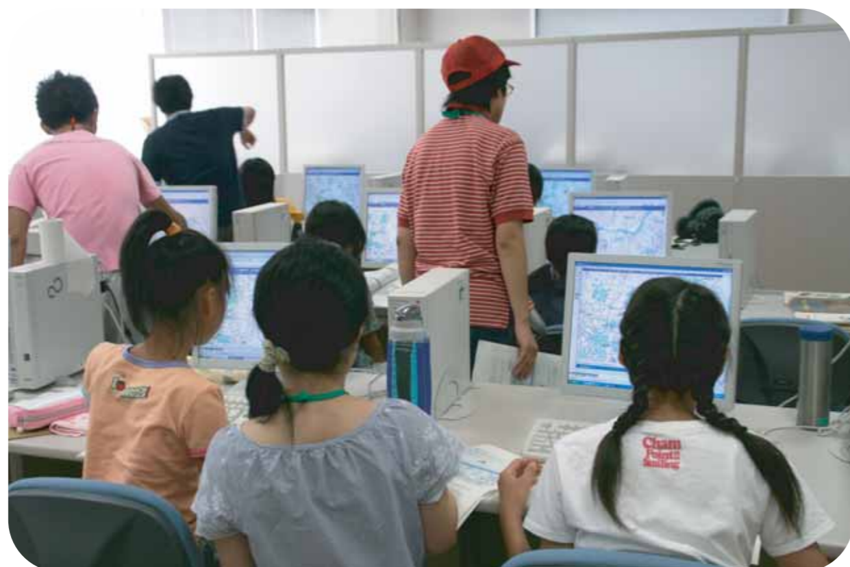
パソコンを活用した情報収集